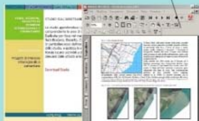
Studi, ricerche, progetti interregionali e comunitari per la individuazione di strategie e strumenti per la sostenibilità nella gestione delle risorse ambientali.