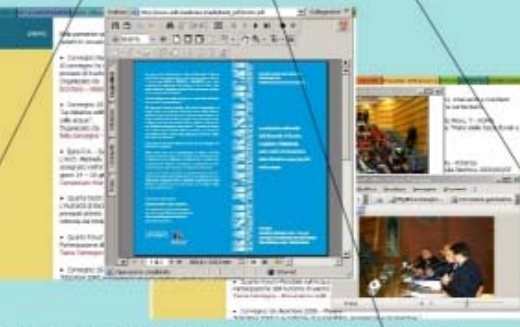
News, eventi, convegni, atti amministrativi, bandi, avvisi di gara, contatti, link, mappa del sito