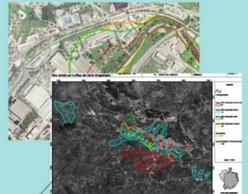
Piani stralcio di Bacino: documentazione cartografica, descrittiva e normativa dei piani per la difesa dal rischio idrogeologico (frane) e idraulico (alluvioni), e per la gestione delle risorse idriche (piano del bilancio idrico e del deflusso minimo vitale).