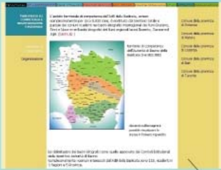
Territorio di competenza e organizzazione funzionale.

L'autorità di Bacino della Basilicata ha vinto il primo premio del concorso "Pubblica Amministrazione lucana che comunica e condivide", bandito dal Consiglio Regionale della Basilicata nel dicembre 2007, per la sezione "miglior progetto internet"