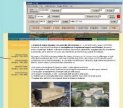
Polizia idraulica: ricognizioni, schede di rilevamento, documentazione fotografica sulle situazioni di pericolosità incombente e potenziale, rilevati lungo i corsi d'acqua lucani.