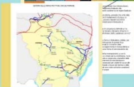
Accordo di Programma per l'uso condiviso delle risorse idriche fra le Regioni Basilicata, Puglia e lo Stato: dati, informazioni e stato di attuazione sull'AdP finalizzato alla regolamentazione dei processi di pianificazione e gestione delle risorse idriche condivise fra le due regioni.