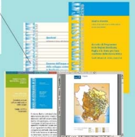
Pubblicazioni, relazioni, saggi e scritti: Collane editoriali dell'AdB "Studi e Ricerche" e "Quaderni", relazioni annuali sull'uso del suolo e delle acque, articoli e recensioni su riviste di settore.