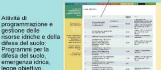
Attività di programmazione e gestione delle risorse idriche e della difesa del suolo: Programmi per la difesa del suolo, emergenza idrica, legge obiettivo.